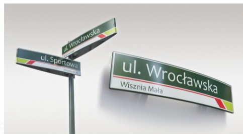
TABLICE Z NAZWAMI ULIC