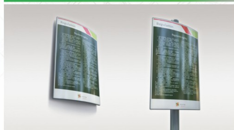
TABLICE Z REGULAMINAMI