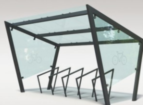
■ WIATY ROWEROWE