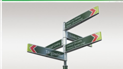
DROGOWSKAZY DLA PIESZYCH