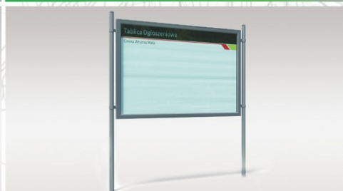
TABLICE I GABLOTY OGŁOSZENIOWE