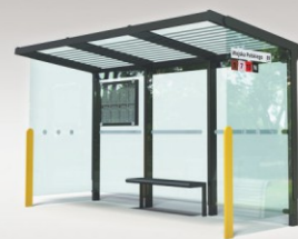
■ WIATY PRZYSTANKOWE