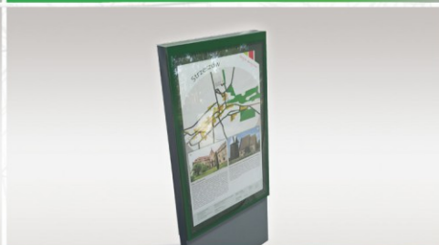
TABLICE I GABLOTY Z PLANEM MIASTA