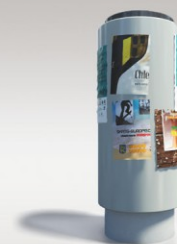
■ SŁUPY OGŁOSZENIOWE