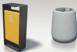
■ KOSZE NA ODPADKI