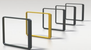
■ STOJAKI NA ROWERY