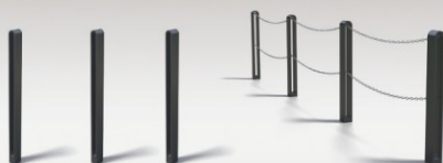
■ SŁUPKI WYGRODZENIOWE