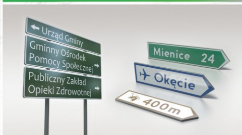
DROGOWSKAZY DLA KIEROWCÓW