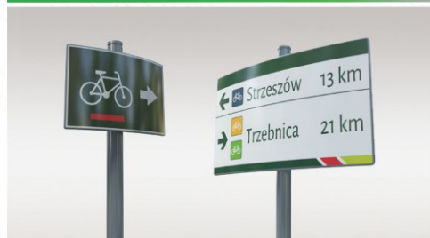
DROGOWSKAZY DLA ROWERZYSTÓW